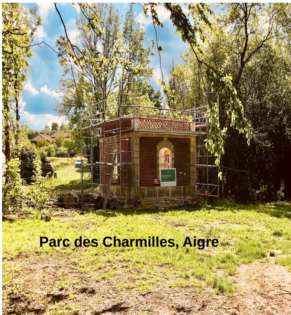
Parc des Charmilles, Aigre

+11,6 millions € de dotations exceptionnelles